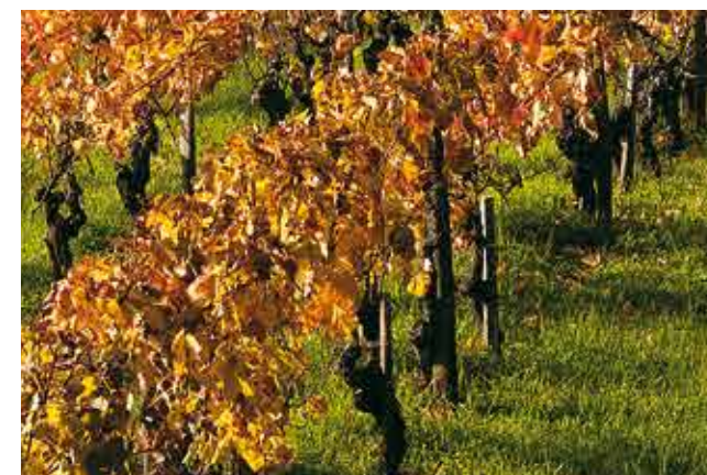
Paysage de vignes de la rive droite (Plassac).