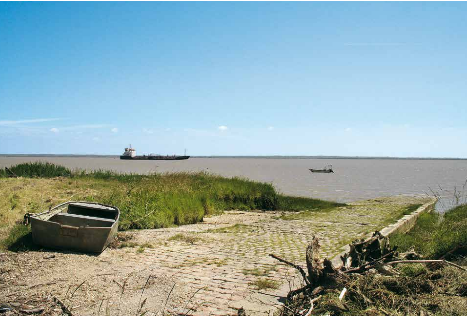
• Cale du port de Saint-Estèphe en Médoc.

Le succès des vins produits sur les rives de l'estuaire est directement lié à la présence de cet axe de circulation majeur, atout considérable pour le commerce viticole. Au croisement des chemins, à proximité des ports et non loin des principales gares ferroviaires, les domaines, prestigieux ou plus modestes, ont bénéficié de ce réseau de communication pour diffuser leur production localement, à Bordeaux ou à Cognac, et à l'étranger.