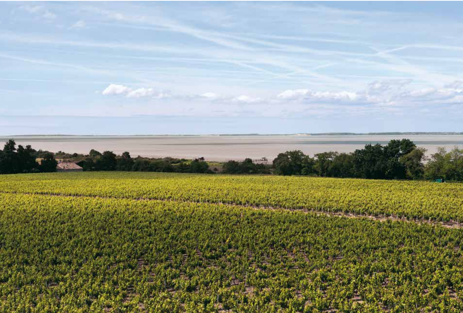
• Croupe de graves dominant l'estuaire en Médoc (Bégadan).

Au visiteur arpentant les bords de l'estuaire s'impose l'immensité des vignes qui s'étendent à perte de vue. D'une rive à l'autre, les rangs réguliers rythment les paysages. Aucune monotonie cependant : aux terres basses du Médoc s'opposent les falaises et les coteaux de la rive droite. Lumière et chaleur renvoyées par les eaux limoneuses de l'estuaire ont favorisé le développement de la vigne, tandis que le climat océanique aux hivers doux et aux étés chauds contribue à son épanouissement.